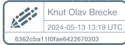
Knut Olav Brecke