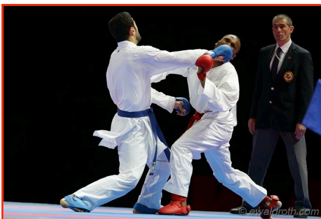
Finale Kumite lag herrer

Referee i tungvektsfinale for herrer, Bronsefinale i kumite lag herrer samt katafinale både i lag og individuelt var noen av høydepunktene jeg fikk anledning til å dømme. Likevel var det finalen i kumite lag herre mellom Tyrkia og Frankrike som toppet det hele. Hvilket fyrverkeri av noen matcher hvor lagene vekslet på å lede helt til siste kamp som skulle vise seg å bli den avgjørende.